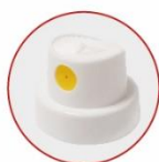
WHITE/YELLOW PAINTING PRODUCTS ACTUATOR

Odstraňte bezpečnostní plombu na uzávěru, abyste otevřeli sprej.